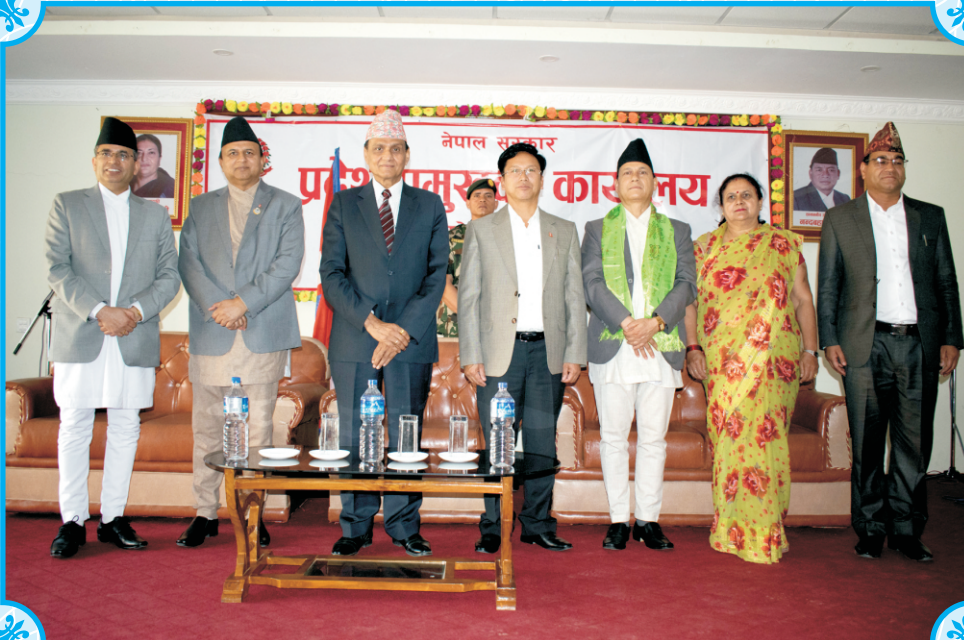
सपथ ग्रहण पश्चातको सामुहिक तस्वीर